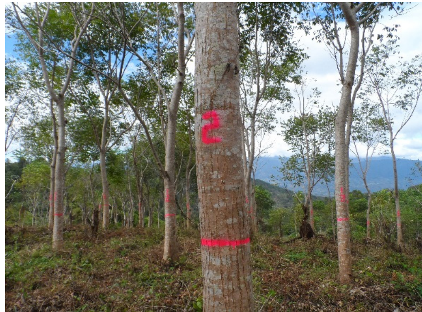
Figura 1. Plantación de cedro finca La Cartuchera, Gualán, Zacapa

El análisis de esta base de datos dasométrica condujo a la elaboración del informe sobre la “Dinámica de crecimiento y productividad de 28 especies en plantaciones forestales de Guatemala” que presenta resultados como funciones de crecimiento para las variables índice de sitio, altura total [m], diámetro [cm], área basal [m 2 /ha], y volumen total [m 3 /ha] las cuales resumen la dinámica de crecimiento de las especies evaluadas.